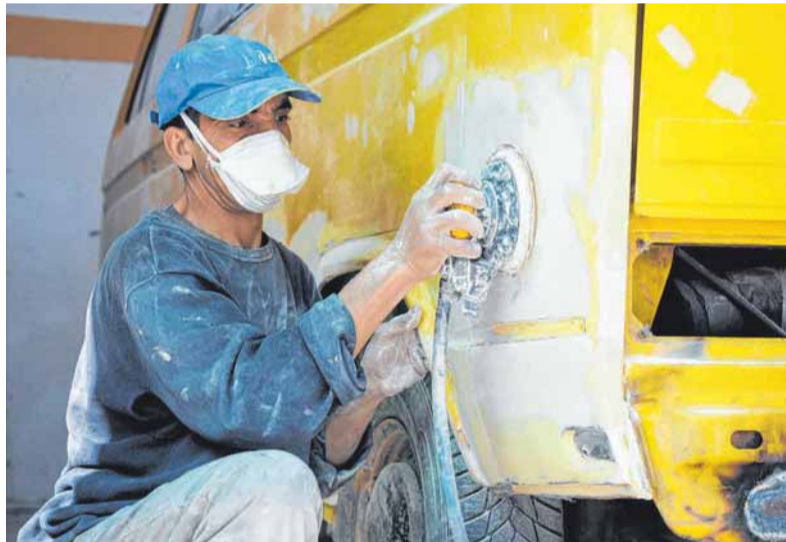
Feinschliff in Agadir: Bus „Willi“ wird auf Vordermann gebracht.

Immer wieder sprechen wir mit den Besitzern und alle erzählen uns dasselbe – sie haben ihre Busse hier in Marokko rostbehandeln und lackieren lassen. Arbeiten, die bei uns auch schon lange anstehen, in Deutschland jedoch kaum bezahlbar sind. Hier erzählt man uns jedoch, dass wir unseren Bus in Marokko sicher für unter 1000 Euro komplett entrostet und neu lackieren lassen