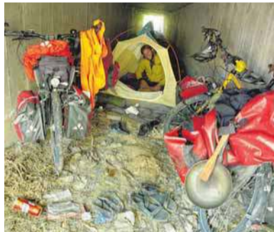
Entlang der Autobahn wird auch in der Unterführung gezeltet.

Wir studieren die Landkarte und finden eine kleinere Straße, die uns durch einen weiteren Gebirgszug Richtung Zhangye und den dort gelegenen malerischen „Regenbogen-Bergen“ führt. Wir genießen die ruhigen Tage und die atemberaubenden Landschaften. Wir wandern auf einen Berg nahe einem unserer Schlafplätze und entdecken einen