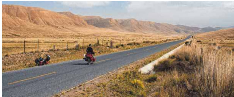
Endlose Steppen müssen die Radler in Kasachstan durchqueren, bevor sie nach China kommen.

tenattraktion verwandelt wurde. Man kann nicht einmal einen kurzen Blick auf die eigentliche Sehenswürdigkeit erhaschen, ohne ein hohes Eintrittsgeld zu bezahlen. Damit nicht genug kann man sich innerhalb des Parks nicht einmal frei bewegen. Man wird mit den in unfassbaren Massen vorhandenen Touristen in Busse verfrachtet, welche einen von Aussichtsplattform zu Aussichts-