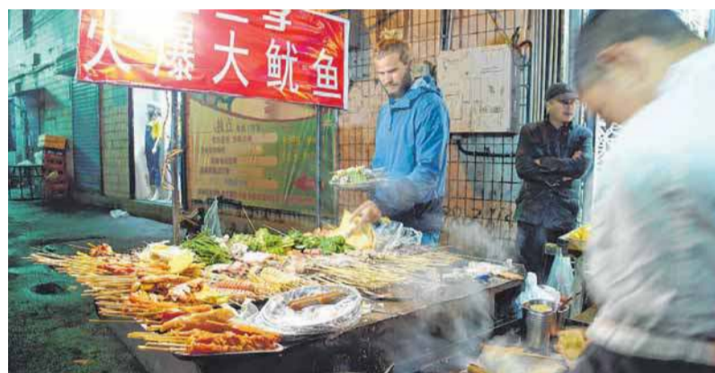
Die Radler probieren fleißig - außer eingelegte Hühnerfüße.

von Urumqi nach Jiayuguan mit dem Zug zurückzulegen. Unterwegs verlassen wir diesen nochmals für einen eintägigen Ausflug zu der historischen Ruinenstadt von Turpan, welche ihrerzeit eine der wichtigsten Handelspunkte der alten Seidenstraße darstellte. In Jiayuguan angekommen schleichen wir uns durchs Gelände zu einem der beiden Ausläufer der Chinesischen Mauer, welche hier ihren Anfang nimmt, und umgehen so den überhöhten Eintritt sowie die Touristenscharen.