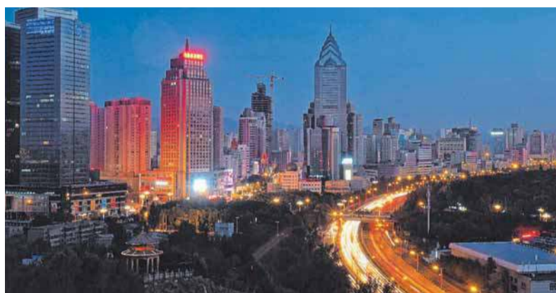
Vor allem die Baukunst in China begeistert die beiden Radler.

Als wir bei den „Regenbogen-Bergen“ ankommen, bemerken wir wie so oft, dass der Weg das Ziel ist. Aus der Ferne können wir die bunt gestreiften Berge und Hügel erahnen. Beim Näherkommen realisieren wir, dass der gesamte Nationalpark zu einer für China so typischen Touris-