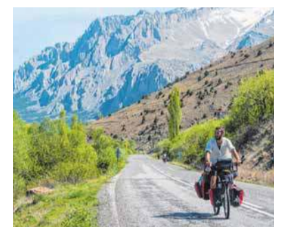
Gastfreundlichkeit, wunderschöne Natur, abenteuerliche Schlafplätze und viele geradete Kilometer: Es geht weiter nach Georgien.

entwickelt. Sei es die Reisegeschwindigkeit, die Anzahl und Länge der Pausen, Essgewohnheiten, die Suche nach einem geeigneten Schlafplatz, die Abend- sowie Morgengestaltung, einfach alles. Man teilt 24 Stunden eines jeden Tages miteinander.