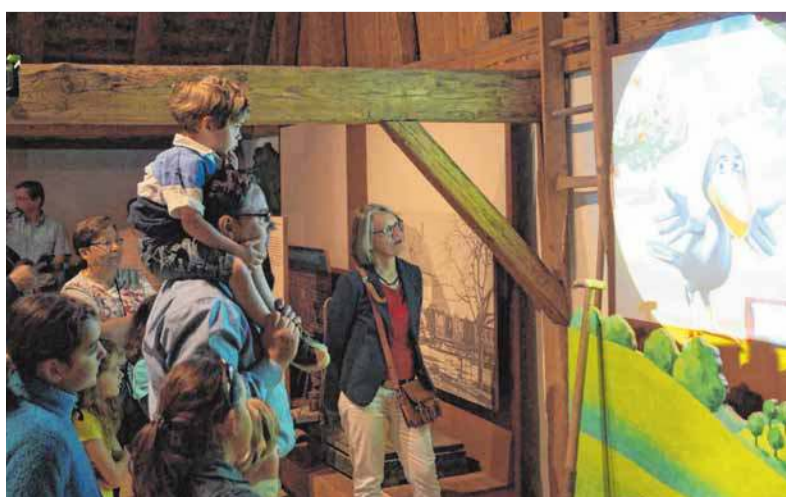
Ein Rabe versetzt die Kinder in Staunen: Das Obstmuseum hat eine neue Attraktion.

reichlich Spaß mit dem Raben haben, der munter durch das Gebälk im Allweierhaus fliegt und auf lockere